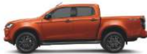
— Valencia Orange