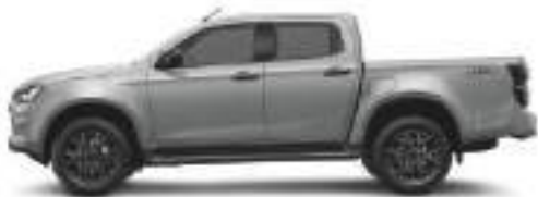
— Mercury Silver met