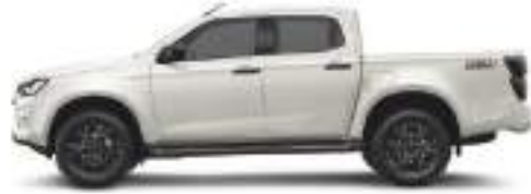
— Dolomite White pearl