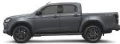
— Islay Gray mica