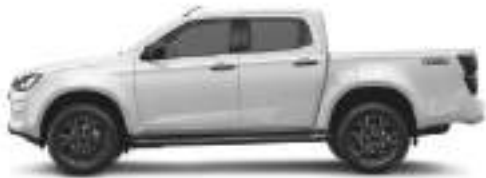
— Splash White