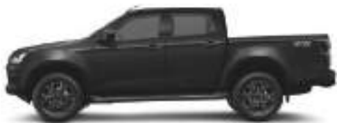
— Onyx Black mica